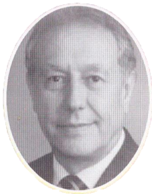
Prefeito Francisco Sérgio Turra