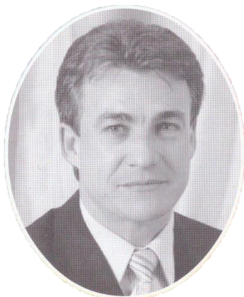
Prefeito Vilmar Perin Zanchin